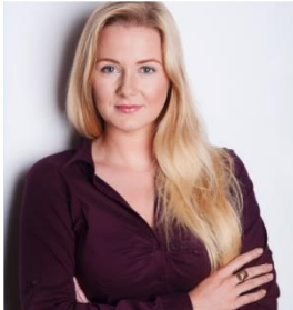
Majka Zabokrzycka Fundacja Dom Pokoju